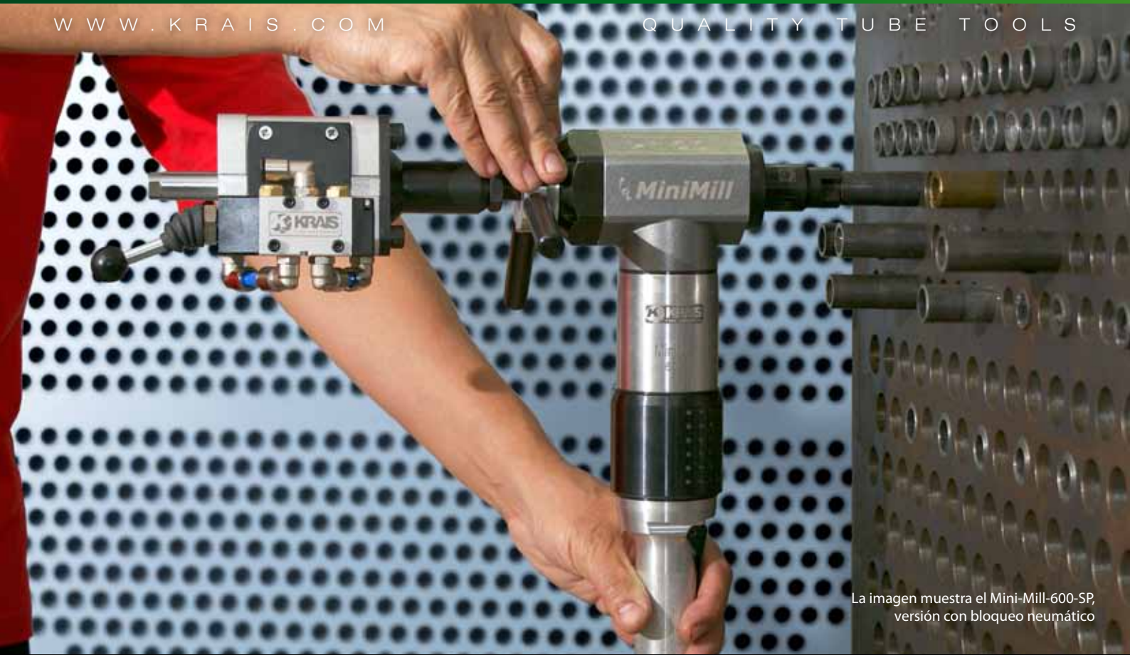
La imagen muestra el Mini-Mill-600-SP, versión con bloqueo neumático