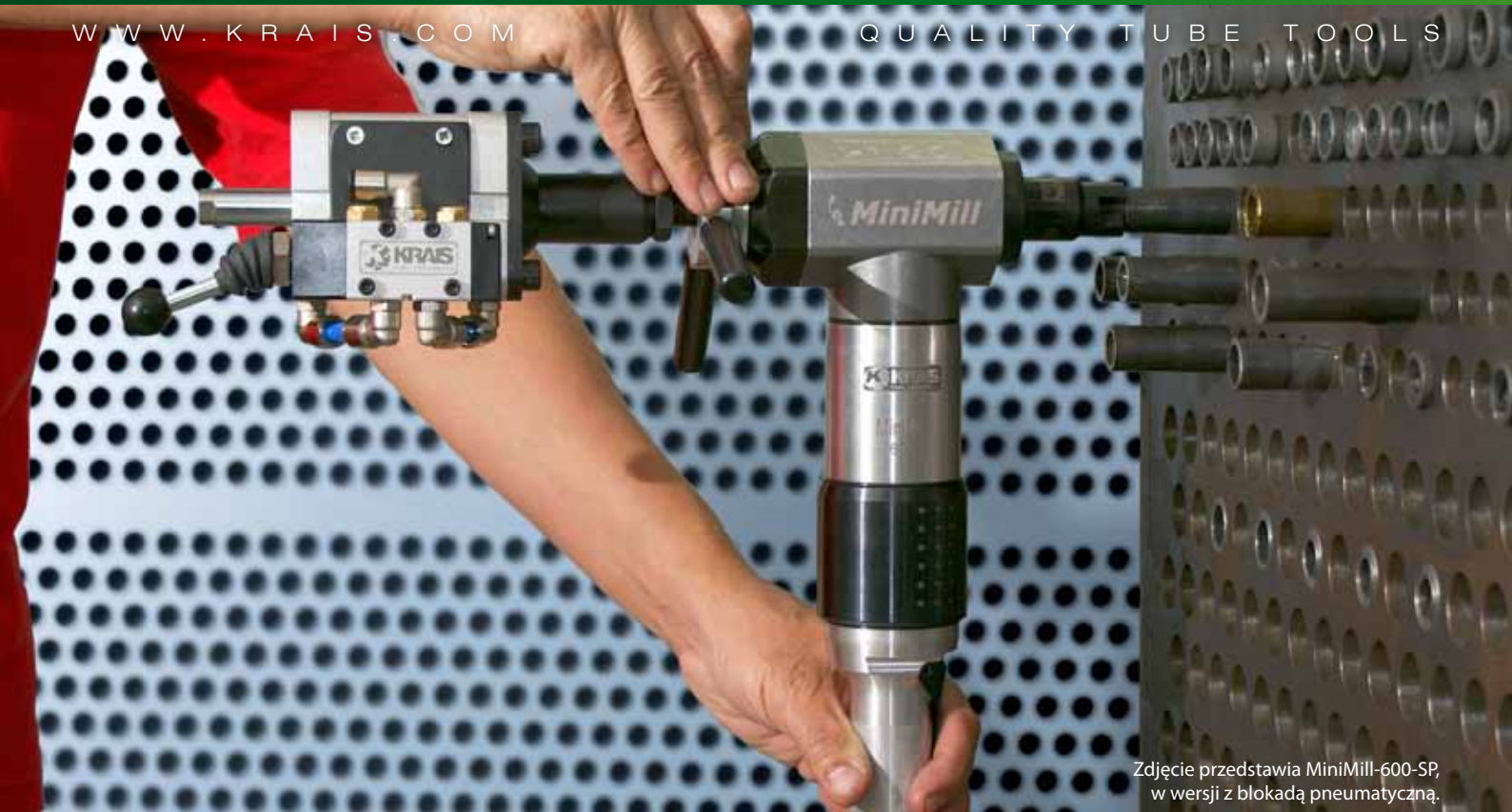
Zdjęcie przedstawia MiniMill-600-SP, w wersji z blokadą pneumatyczną.